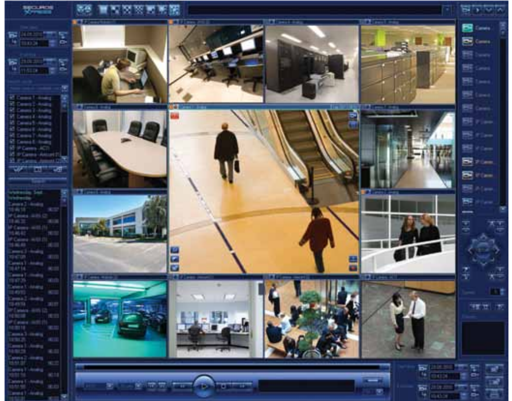
Standard View with PTZ Control for IP and Analog Cameras.

SecurOS Xpress es una solución ideal para la grabación de vídeo y gestión para pequeñas y medianas instalaciones de seguridad con capacidad de vigilancia en la red. Con