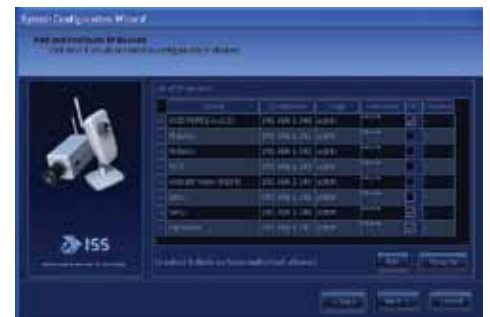
Wizard Configuration seamless setup by step wizards.

SecurOS Xpress soporta cámaras analógicas e IP, utilizando cámaras de megapixel en su resolución nativa. El sistema opcional de captura de placas de ISS garantiza la conexión inmediata a las actuales cámaras analógicas instaladas, cuando sea necesario. Esto hace SecurOS Xpress perfecto para la migración de lo analógico a IP para proyectos más pequeños, de la manera más rentable.