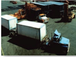
Port Management -Truck based