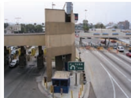
Border Crossings, Access and Gate Control Systems