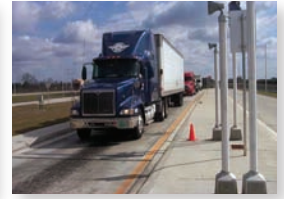
Mobile Inventory Systems Weigh-in Stations