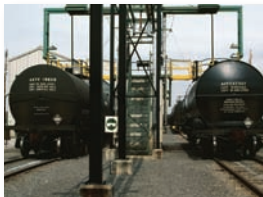
Rail Cargo Installation