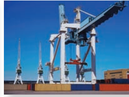
Port Management - Crane based